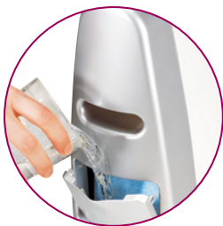
Humidificateur intégré de 0,7 L

Bloc céramique avec résistance blindée noyée