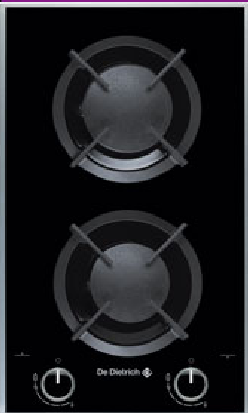
Table de cuisson