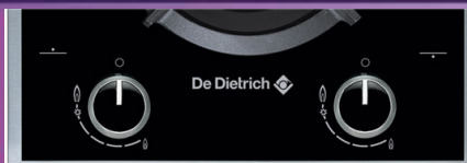
Table de cuisson