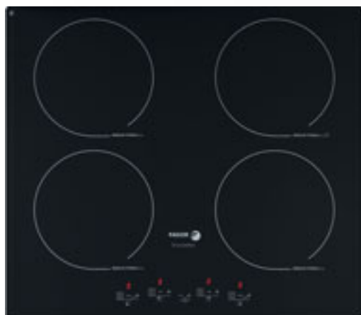
Table de cuisson